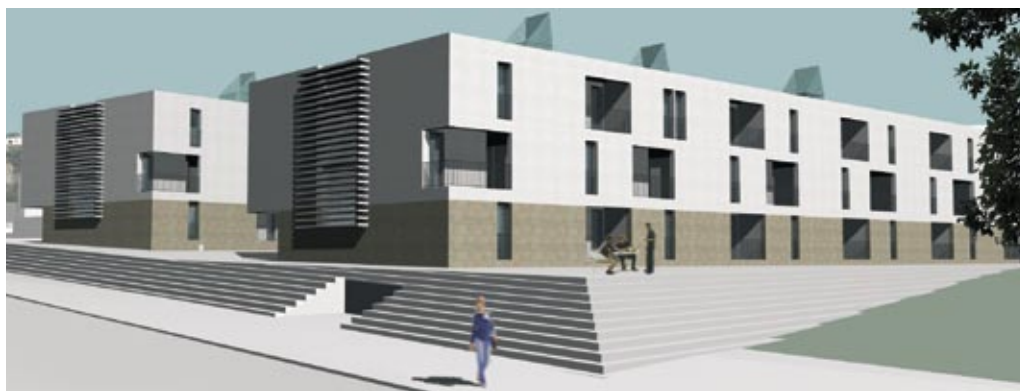
Imatge corresponent a la fase inicial del concurs per encarregar el projecte arquitectònic dels habitatges de Cal Doctor.

El ple de març va aprovar la creació del Patrimoni Públic de Sòl i Habitatge (PPSH), al qual s'hauran d'incorporar, a partir d'ara, tots els immobles i els ingressos monetaris derivats de l'aprofitament urbanístic de cessió obligatòria. En el ple d'abril es va fer l'aprovació provisional de les modificacions del Pla General i del Pla Parcial de Cal Doctor on s'hi construiran dos edificis amb habitatges socials de lloguer. El projecte arquitectònic provisional presenta dos edificis, de planta baixa i dues alçades, amb un total de 61 habitatges. Tots aquests pisos disposaran de la seva