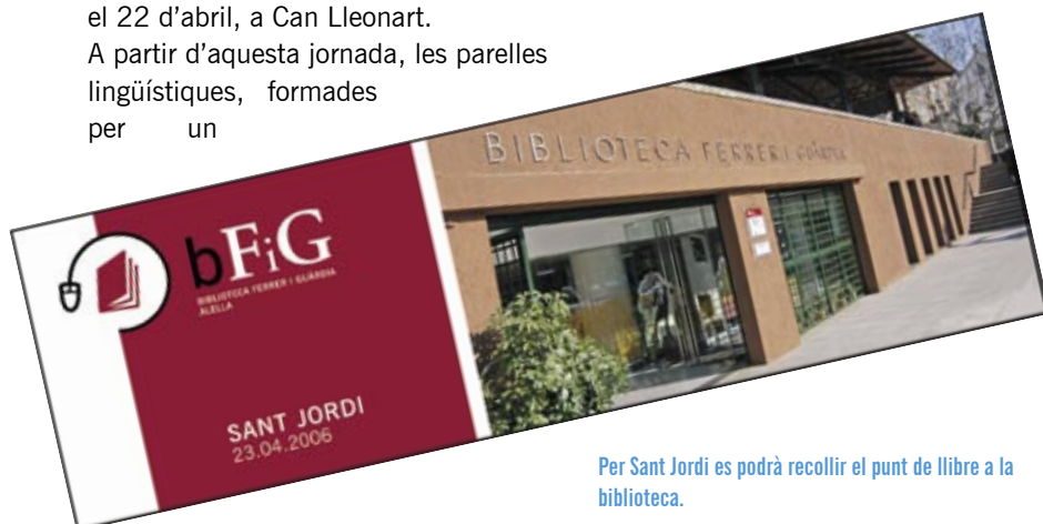
Per Sant Jordi es podrà recollir el punt de llibre a la biblioteca.

Les entrades són gratuïtes i es podran passar a recollir per Can Lleonart els dies 19 i 20 d'abril, d'11 a 14h i de 17h a 20h.