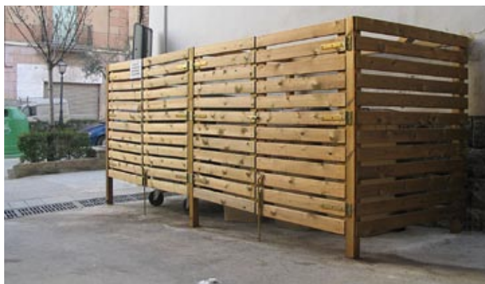
Tancat dels contenidors d'orgànica i rebuig d'un establiment de restauració.

municipals. Amb l'adhesió d'aquests negocis, l'Àrea de Sostenibilitat preveu incrementar la recollida de la matèria orgànica en prop de 100 tones l'any.