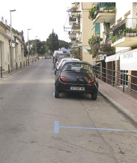
La zona blava es situa en la part baixa del carrer.

El carrer d'Àfrica disposa des d'aquest mes d'abril de vuit places de zona blava gratuïtes amb restricció horària de 30 minuts. Els allelencs han de posar el disc horari, ja que l'aparcament en aquesta zona queda regulat per facilitar la rotació dels vehicles tenint en compte l'activitat i el dinamisme comercial del sector.