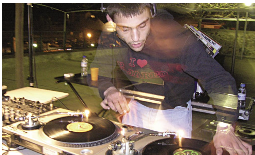
L'acte va acabar amb una sessió de música electrònica.

Per més informació sobre les activitats que organitza el Casal de joves podeu posar-vos en contacte amb la seva dinamitzadora, al telèfon 93 540 85 17, de dimecres a dissabte de 17 a 21h.